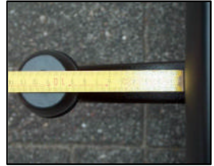
Abstand vom KK zur Stoßstange