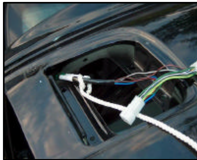
Anschluss des E-Satzes