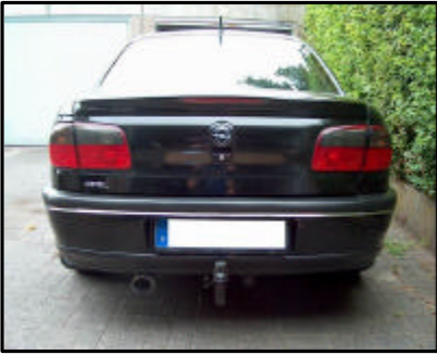
Fahrzeug mit AHK