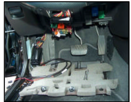
Anschluss des E-Satzes, Blinkrelais und Checkcontrollerweiterung

Beiträge zur Erweiterung bzw. Vervollständigung unserer Informations- bzw. Bilddatenbank honorieren wir mit bis zu 50 Euro. Sollten Sie Interesse haben, setzen Sie sich bitte per E-Mail mit Herrn Auert unter technik@kupplung.de in Verbindung.