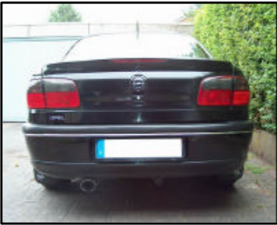
Fahrzeug ohne Kugelkopf