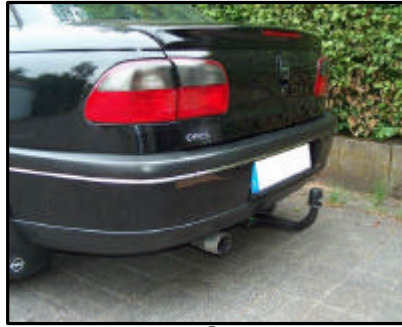
AHK von der Seite